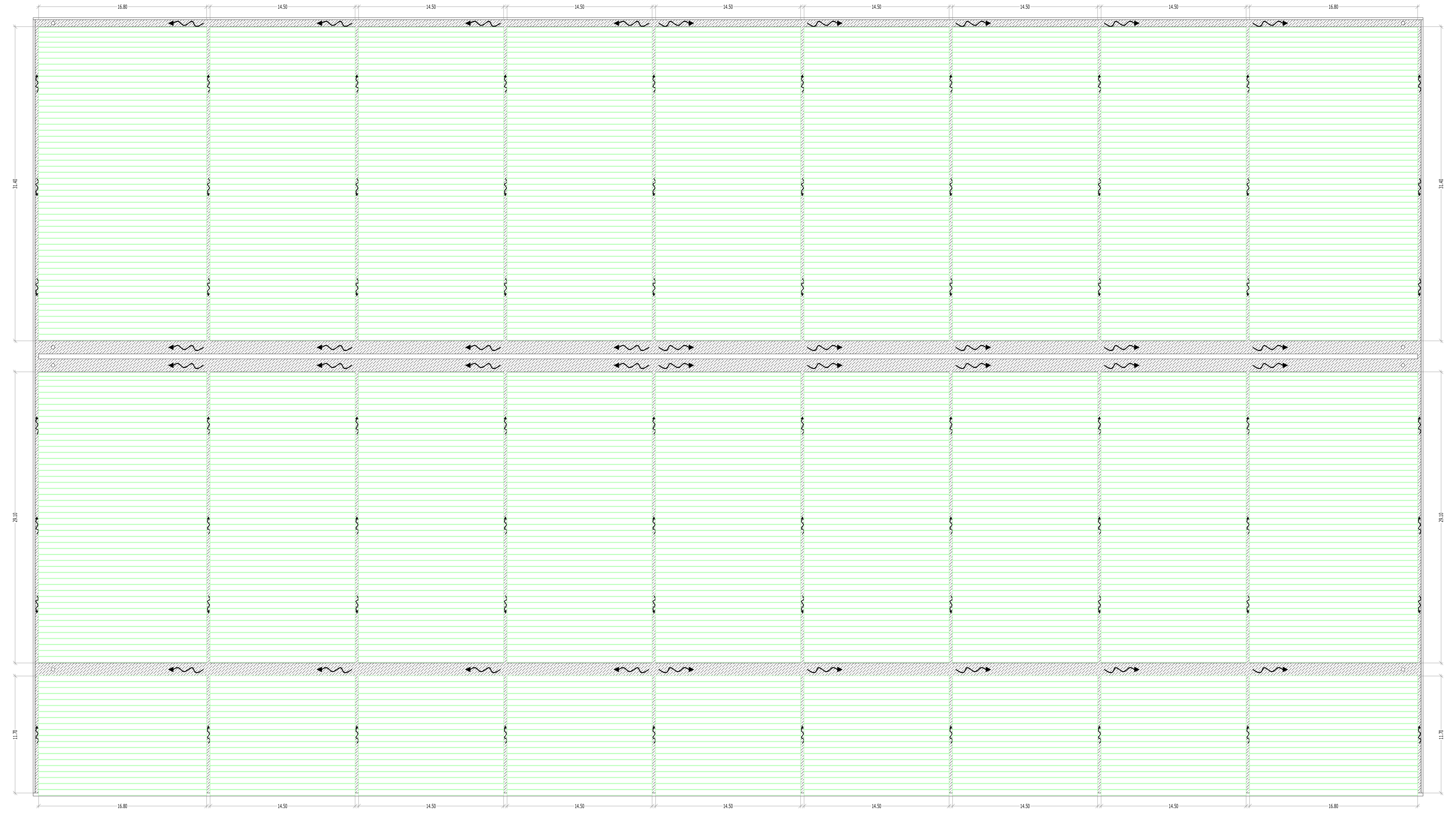
LAYOUT FASE FINALE - POSA LASTRE DI COPERTURA Scala 1:200